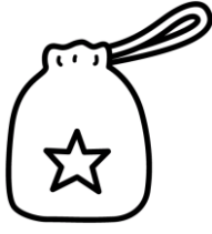
ถุงสำหรับใส่อาหารกลางวัน