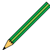
ดินสอ (2B 5 แท่ง/ดินสอสีแดง 1 แท่ง ดินสอสำหรับฝึกเขียน 4B 1แท่ง)