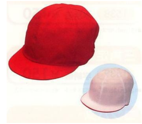
หมวกใส่ในชั่วโมงพลศึกษา

※ สิ่งของที่ต้องเตรียมอาจแตกต่างกันในแต่ละโรงเรียน สิ่งของที่โรงเรียนกำหนด อุปกรณ์ต่างๆ ที่ใช้ในโรงเรียน เขตสำหรับวิชาเลขคณิตมีจำหน่ายตอนงานประชุมอธิบายก่อนเข้าศึกษา (Nyūgaku setsumeikai) ดังนั้นกรุณาฟังรายละเอียดก่อนที่จะหาซื้อ