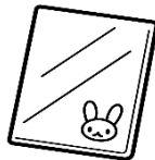
ที่รองเขียน