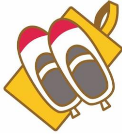
รองเท้าใส่ในโรงยิม (พร้อมถุง) (บางโรงเรียนไม่จำเป็น)