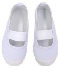
รองเท้าสำหรับใส่เดินในอาคารเรียน